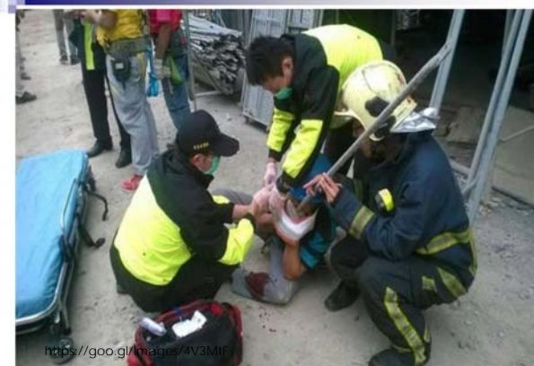
◎工人遭鐵條刺穿下巴。