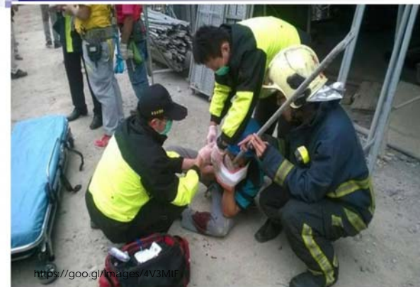
◎工人遭鐵條刺穿下巴。