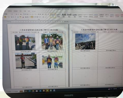
製作工具箱會議紀錄