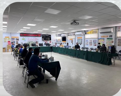
參與協議組織會議