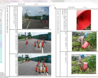
製作缺失改善紀錄表