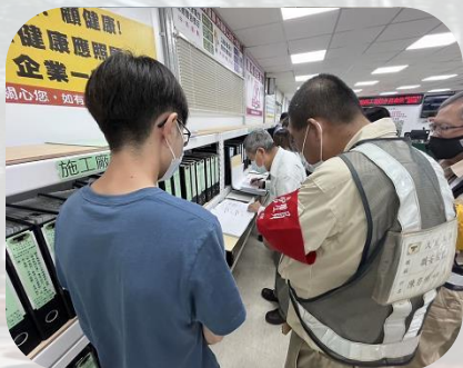
參與中央工程查核