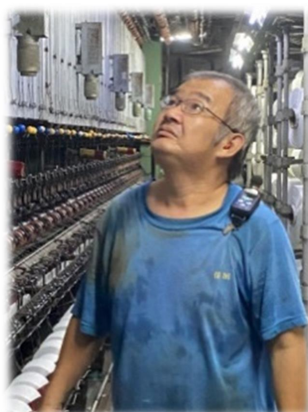
測定噪音的個人採樣