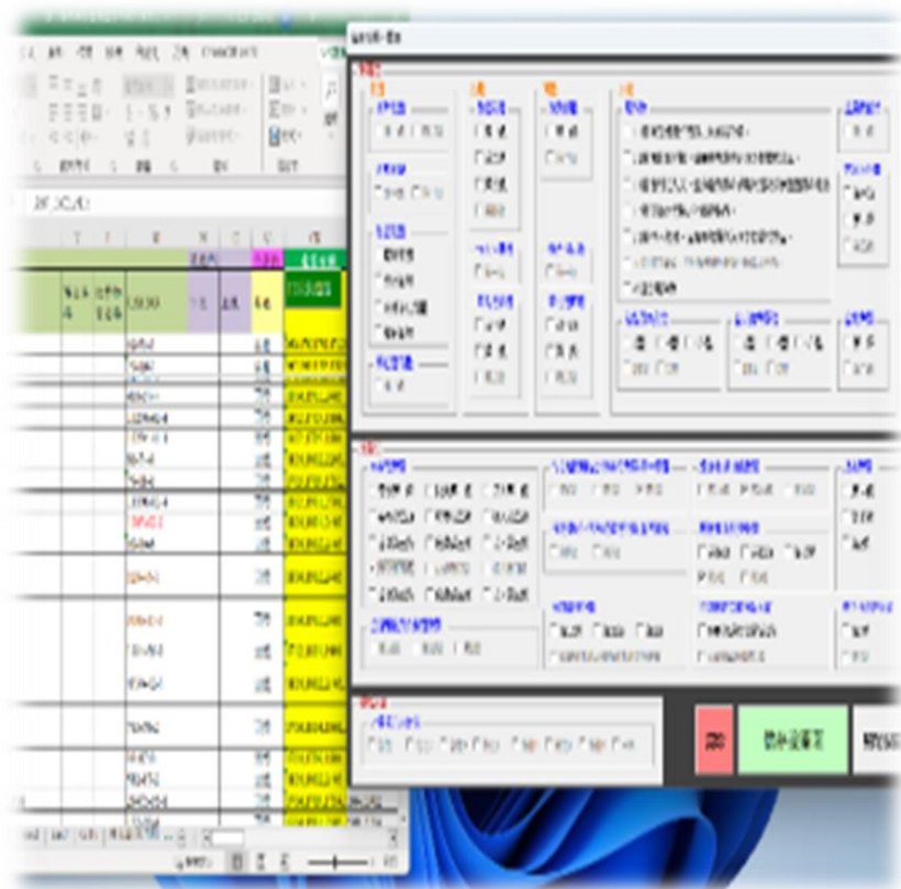
選填某公司的危害分類