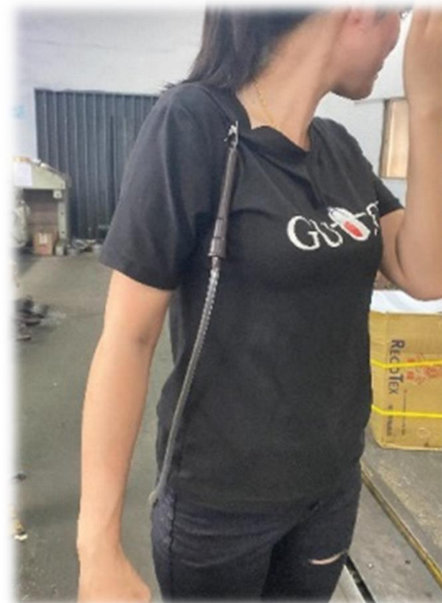
測定氨的個人採樣