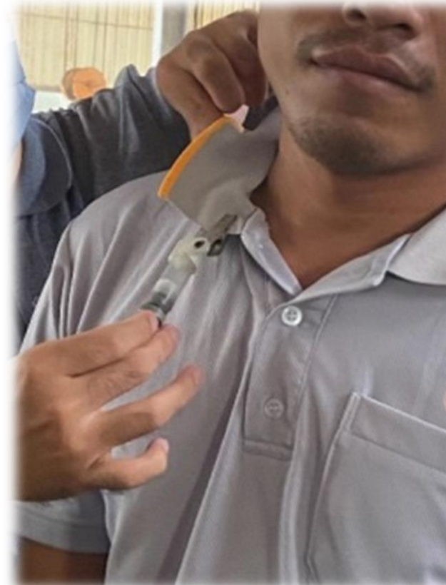
測定硫酸的個人採樣