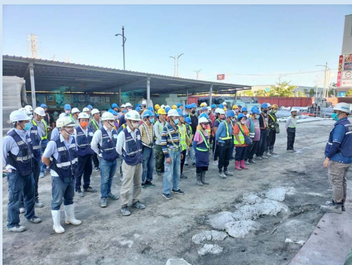
每天早晨工具箱會議 告知當天應注意事項

第一次進入業界工作崗位訓練，跟在學校的感覺有很大的不同，觸及的人事物不再是書面資料，而是親自體會，事業單位的學長姊都很好相處，就算工作訓練崗位結束，最記憶猶新就是課長第一個星期對我說的話：「在職場裡，沒有人是有義務要去教你，而是有問題不懂自己主動詢問，做個主動的人，不要被動。」職安這行業，就是為了勞工安全而共同努力，良好的溝通配上專業的知識，為勞工打造良好的工作品質。