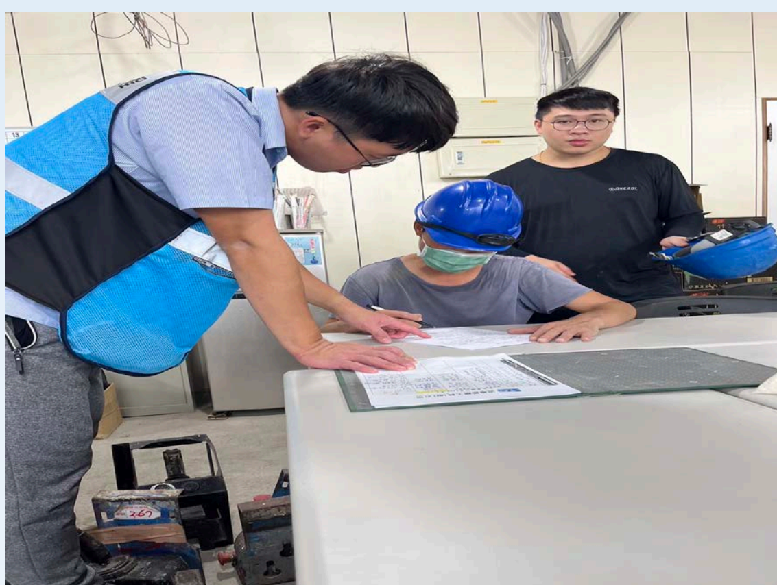
指導勞工填寫入場危害告知