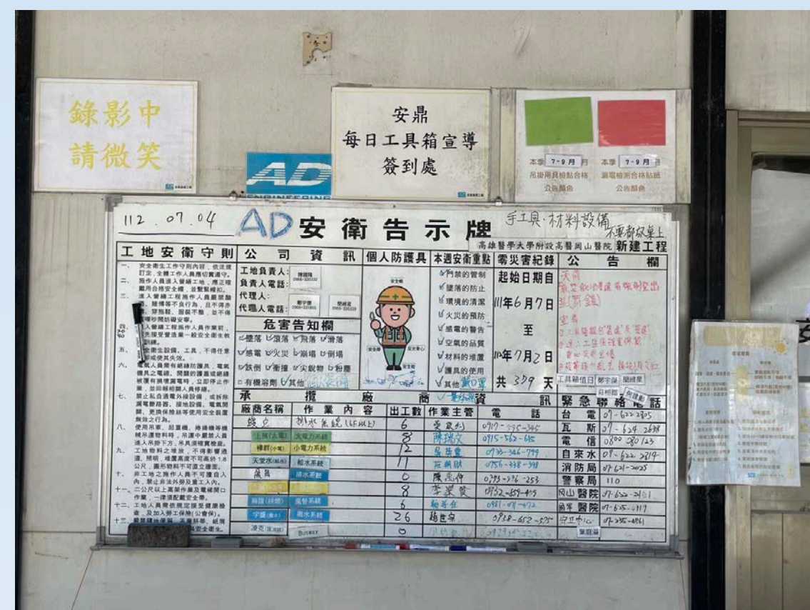
安衛告示牌每日更新