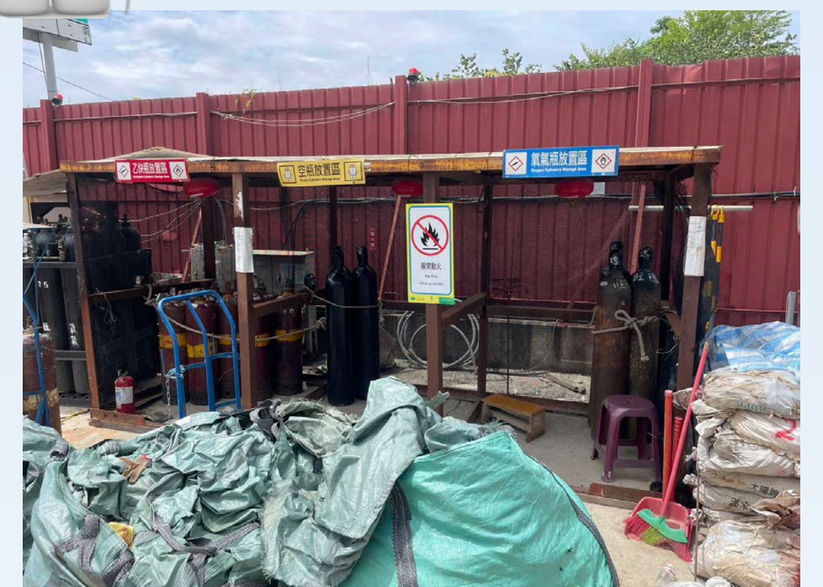
高壓氣瓶應分區放置 附近不可有易燃物品